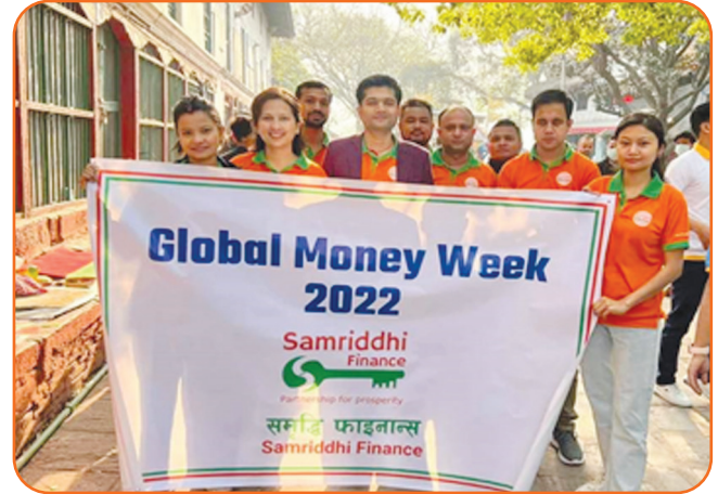
Participating in Global Money Week-2022