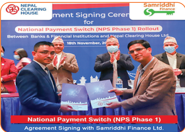
Agreement Between Samridhi Finance and National Payment Switch (NPS Phase 1)