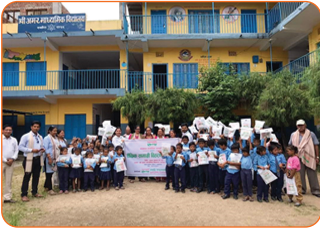
Educational Materials Distribution Program