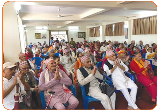
Seniors Citizen Facilitation Program