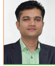
चुडामणि सनाल प्रमुख सञ्चालन विभाग