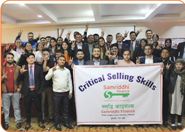
Critical Selling Skills