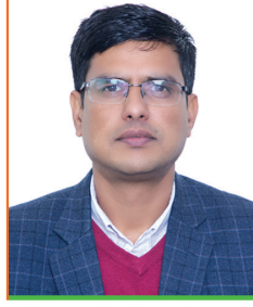
टिका निधि लोहनी प्रमुख कार्यकारी अधिकृत