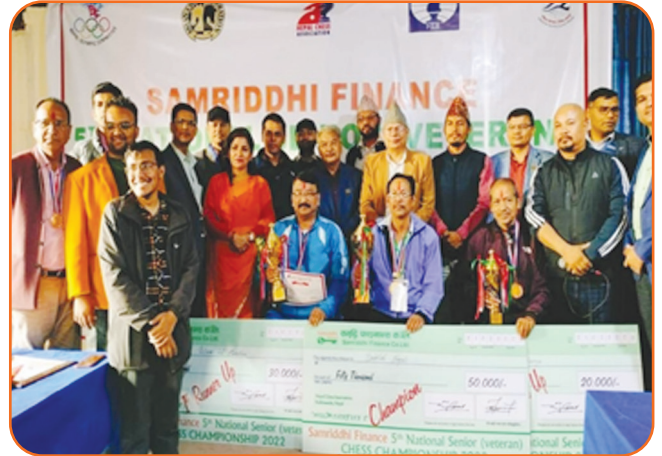
Veteran Chess Competition