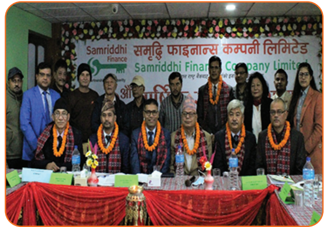
20th Annual General Meeting