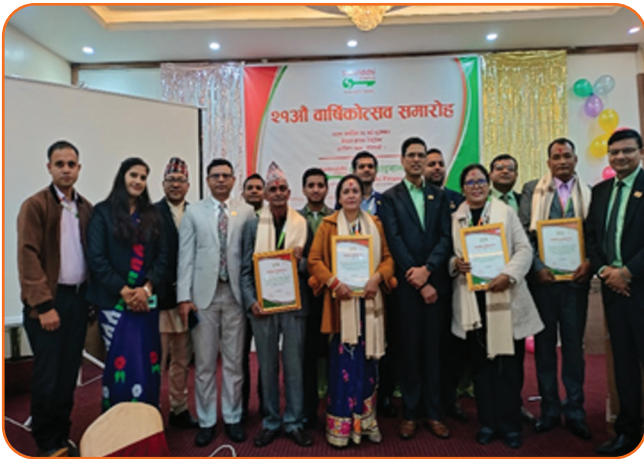
21st Anniversary Program