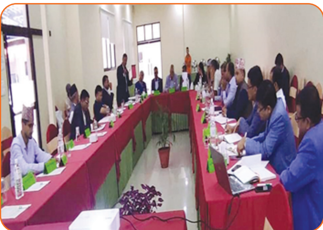
Interaction Program Between Board of Directors, Prime Share Holders and Senior Management Team