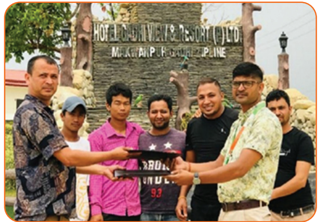
Agreement between Samridhi Finance and Hotel Gadi View