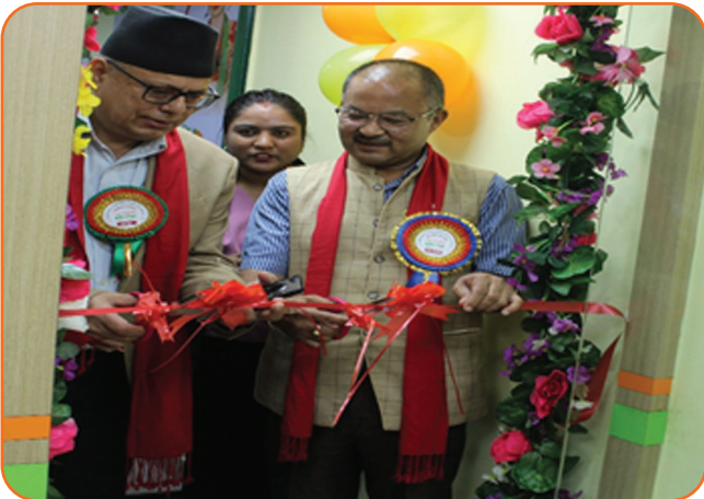
Banepa Branch Opening