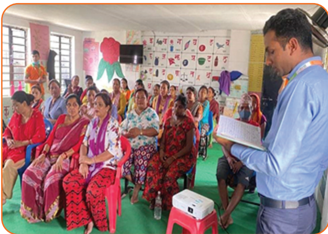
Financial Literacy Program