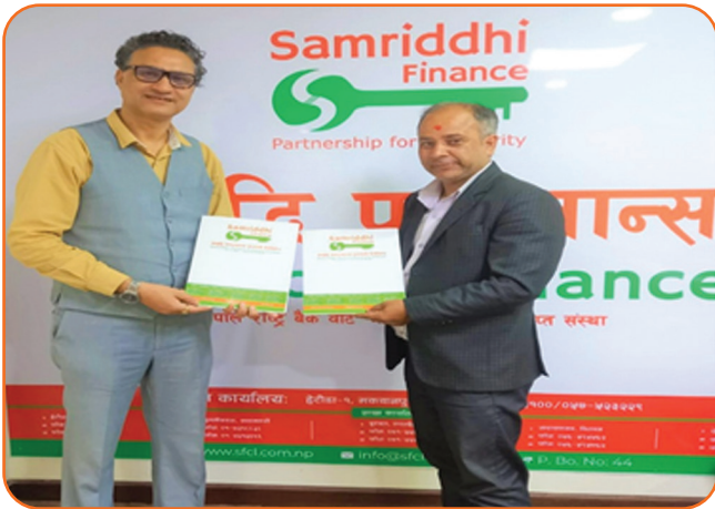
Agreement between Samridhi Finance and Growth Seller