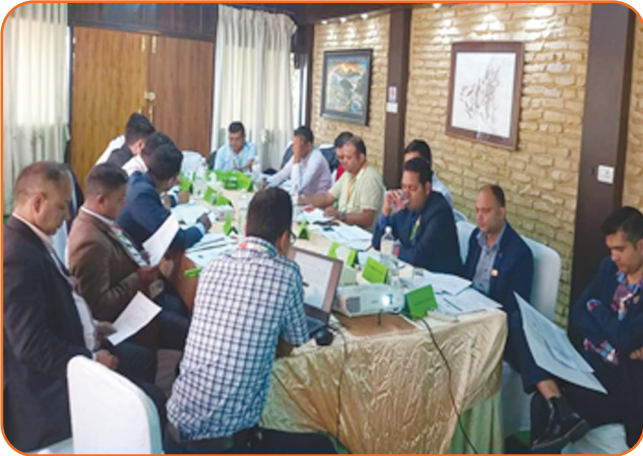
Business Review and Budget Workshop