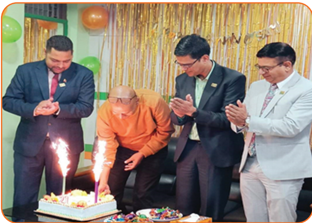
21st Anniversary Celebration