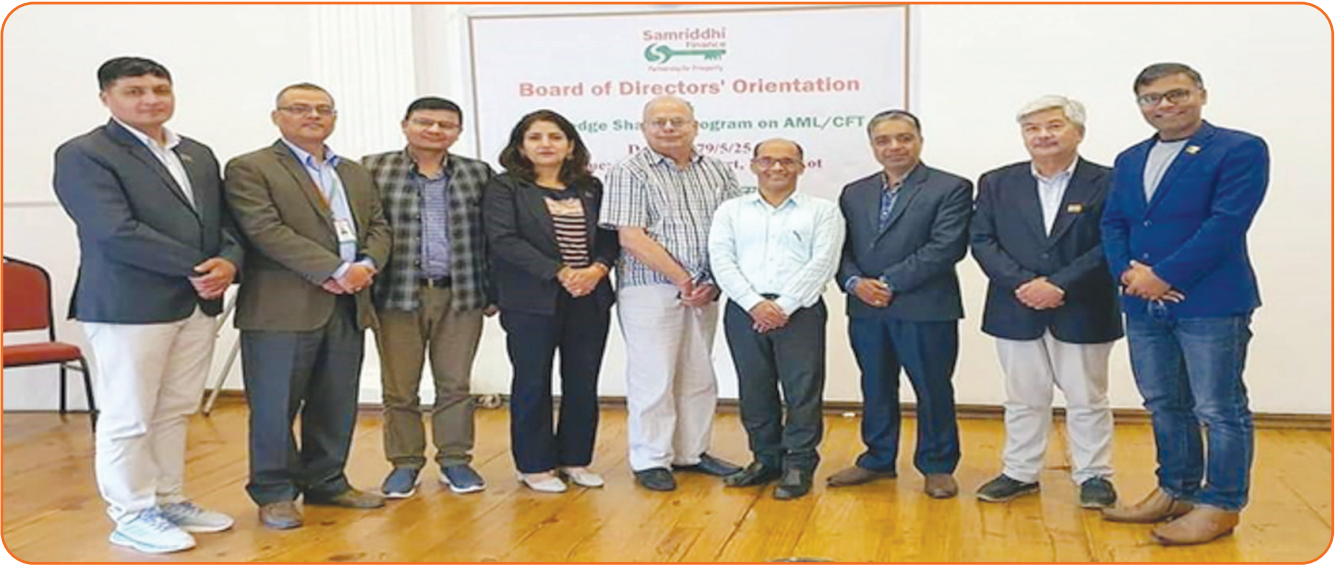
Board of Directors Orientation and Knowledge Sharing Program on AML/CFT-2019