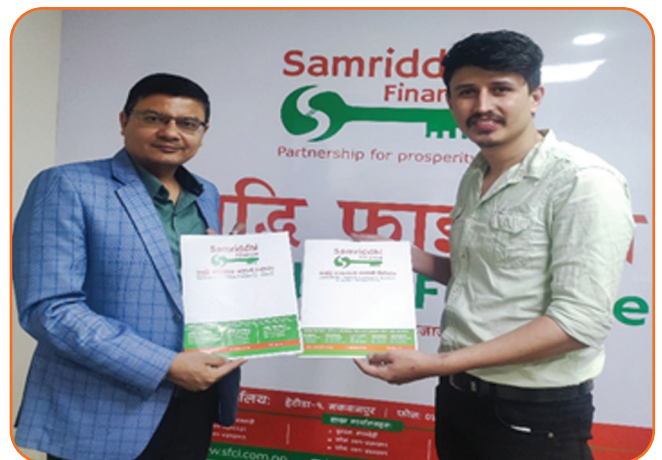
Agreement Between Samridhi Finance and 32 Café