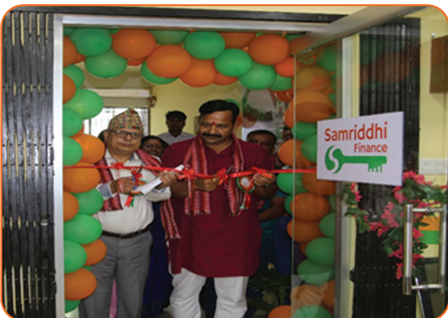
Itahari Branch Opening