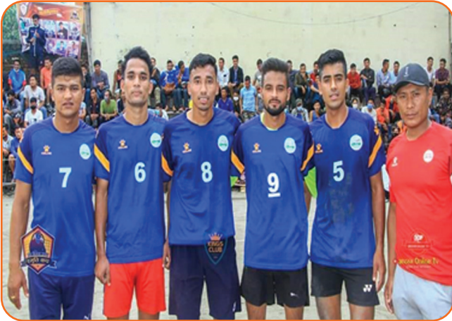
Samridhi Finance Volleyball Team