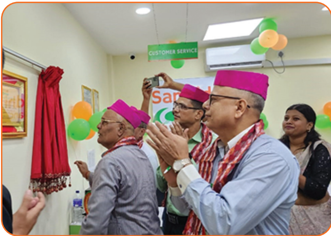
Janakpur Branch Opening