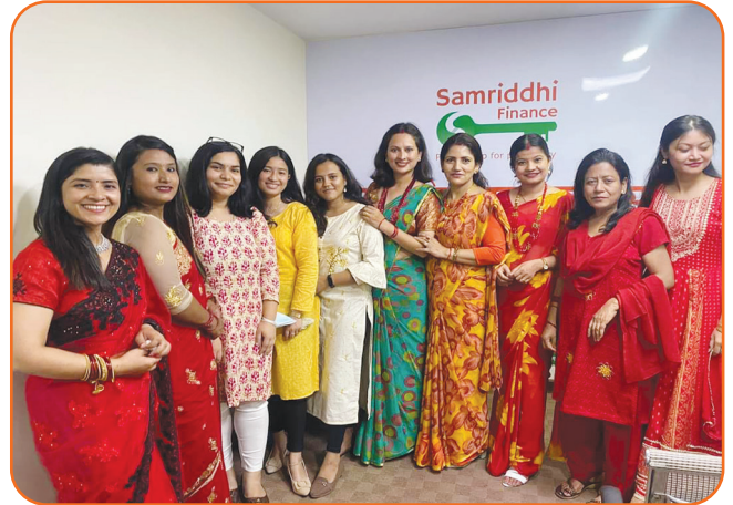
Teej Celebration -2079