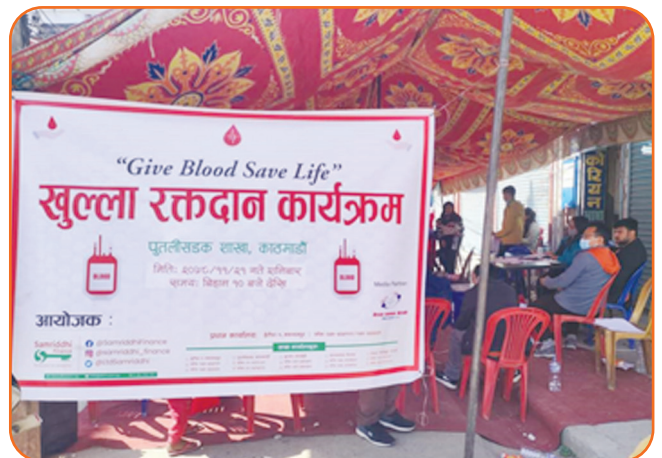
Blood Donation Program